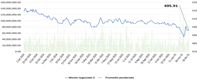
Volumen negociado y Promedio ponderado de Monex